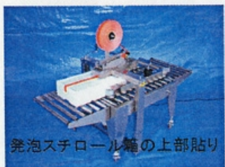
発泡スチロール箱の上部貼り