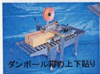
ダンボール箱の上下貼り