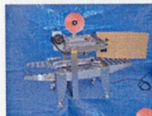
ダンボールの底貼り